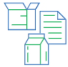
Popierius ir kartonas